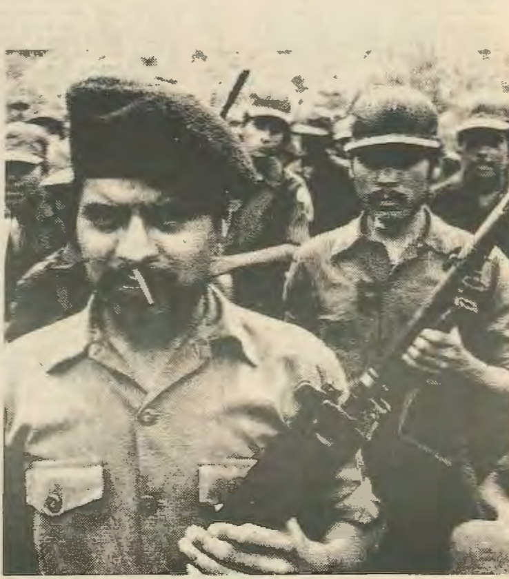
Αντεπαναστάτες στις Ουδούρες. Η τλειωτική τους ήττα θα φέρει τον Αμερικάνικο Ιμπεριαλισμό μπροστα στην ανάγκη να επέμβει στρατιωτικά. Το δίλημμα γι' αυτούς είναι: είτε καταστροφή είτε δάεθρος

Εξ ίσου σοβαρές θα ήταν οι συνέπειες στην υπόλοιπη Λατινική Αμερική όπου θα ξεσηκώνονταν ένας τεράστιος σιμφώνιος επαναστατικών εκρήξεων. Οι επιπτώσεις μέσα στην ίδια την Αμερική δεν πρέπει να υποτιμούνται. Οι Ισπανόφωνοι στις Η.Π.Α. αριθμούν χιλιάδες κι είναι θύματα της ίδιας καταπίεσης κι εκμετάλλευσης όπως οι Ιαίοι. Δεν πρέπει να ξεχνούμε ότι η Αμερική είναι γεμάτη με Ισπανόφωνους που έχουν πάψει να υποτιμούνται. Οι Ισπανόφωνοι στις Η.Π.Α. αριθμούν χιλιάδες κι είναι θύματα της ίδιας καταπίεσης κι εκμετάλλευσης όπως οι Ιαίοι. Δεν πρέπει να ξεχνούμε ότι η Αμερική είναι γεμάτη με Ισπανόφωνους που έχουν πάψει να υποτιμούνται.